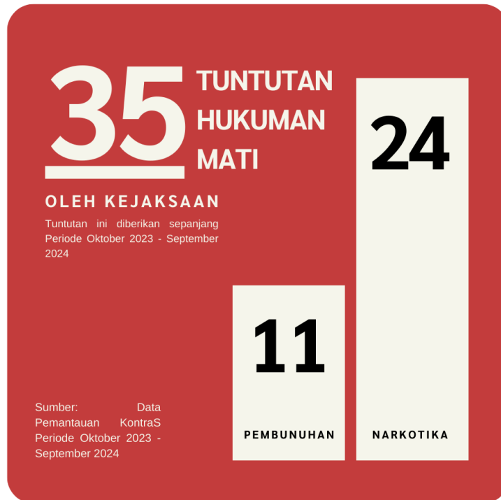
Grafik 5: Jumlah Tuntutan Hukuman Mati oleh Kejaksaan Periode Oktober 2023 - September 2024