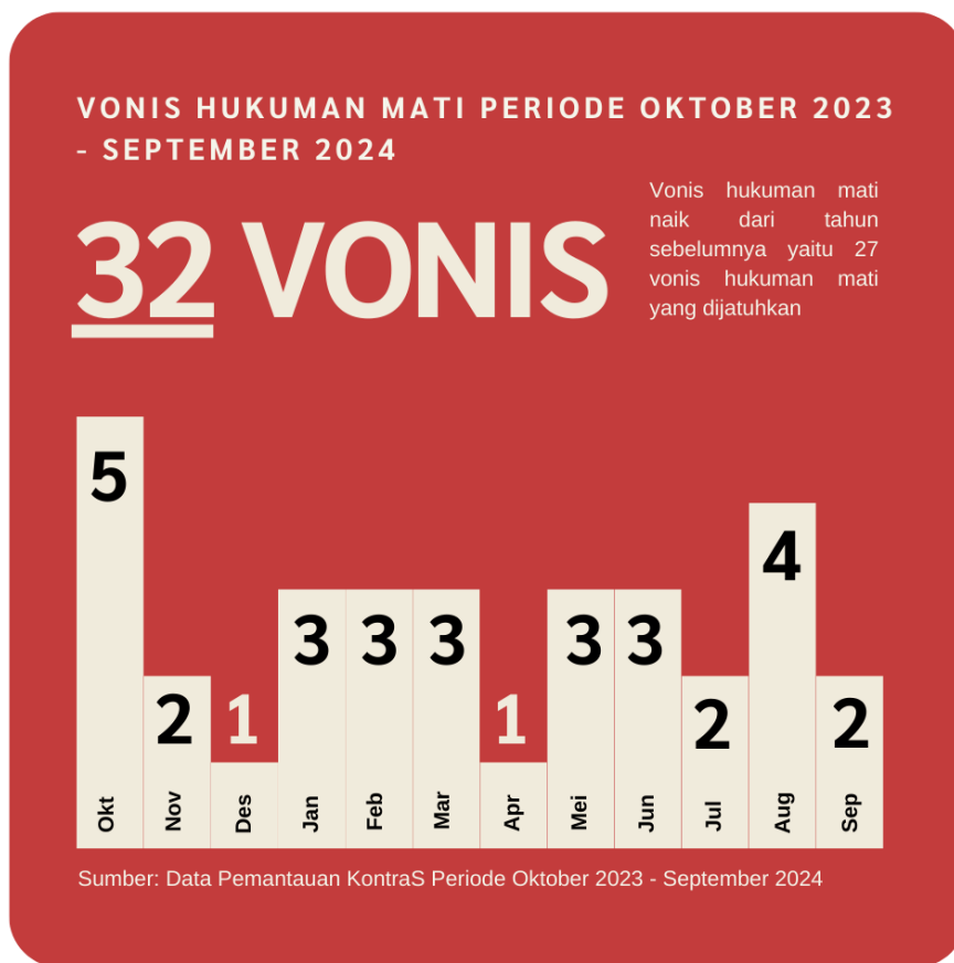
Grafik 2: Jumlah Vonis Hukuman Mati di Indonesia Periode Oktober 2023 - September 2024