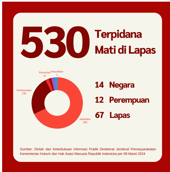
Grafik 1: Jumlah Terpidana Mati di Seluruh Lapas di Indonesia per 08 Maret 2024