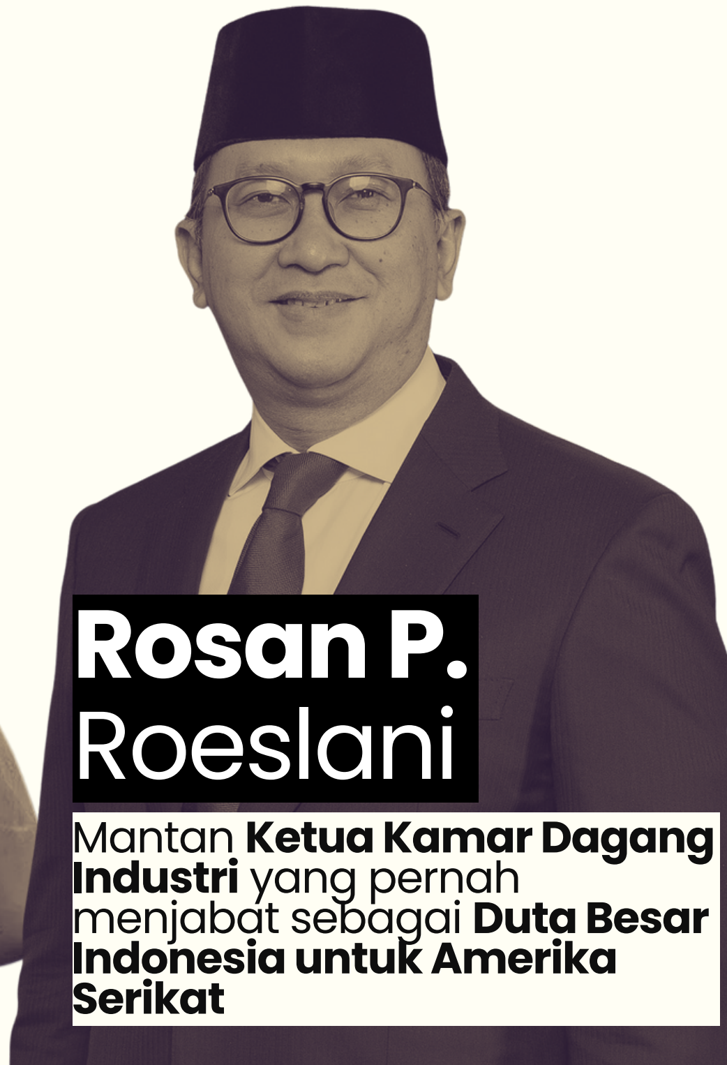
Rosan P. Roeslani

Purnawirawan perwira tinggi Angkatan Udara yang terakhir menjabat sebagai Kepala Badan SAR Nasional .